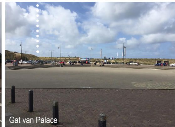
Gat van Palace