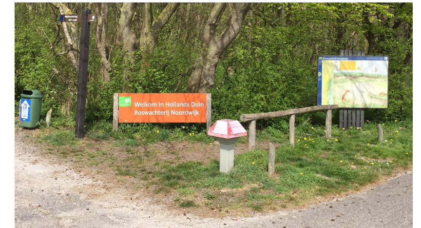
afbeelding: Boswachterij Noordwijk

Eenzelfde verzamelplaats is ook wenselijk dicht bij de kern van Noordwijk, bijvoorbeeld in de buurt van de oude manege. Dit vormt een mooi verzamelpunt voor wandelgroepen om gezamenlijk de duinen in te wandelen.