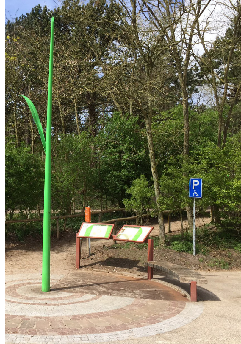
afbeelding: TOP (toeristisch overstap punt) Noordwijk