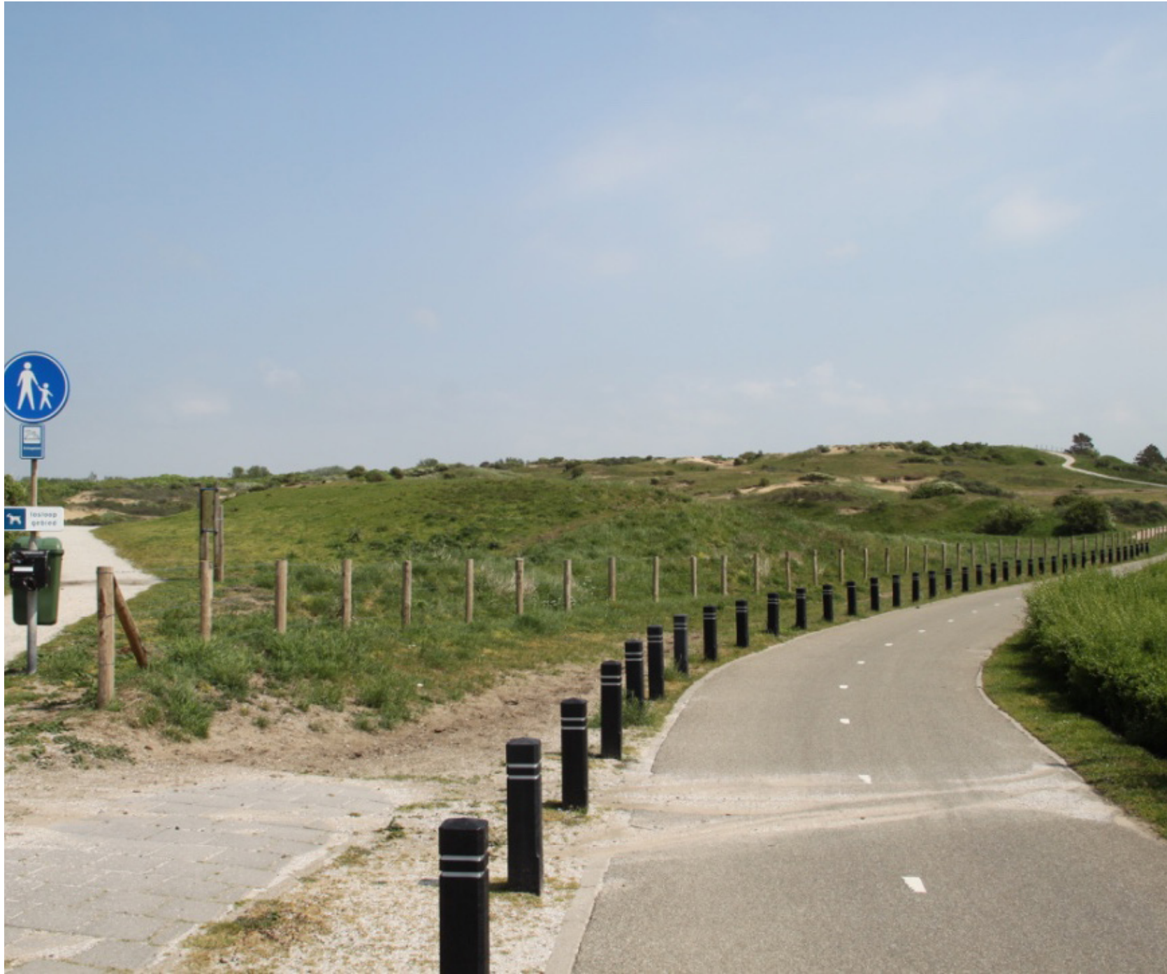
afbeelding: locatie Oude Trimbaan