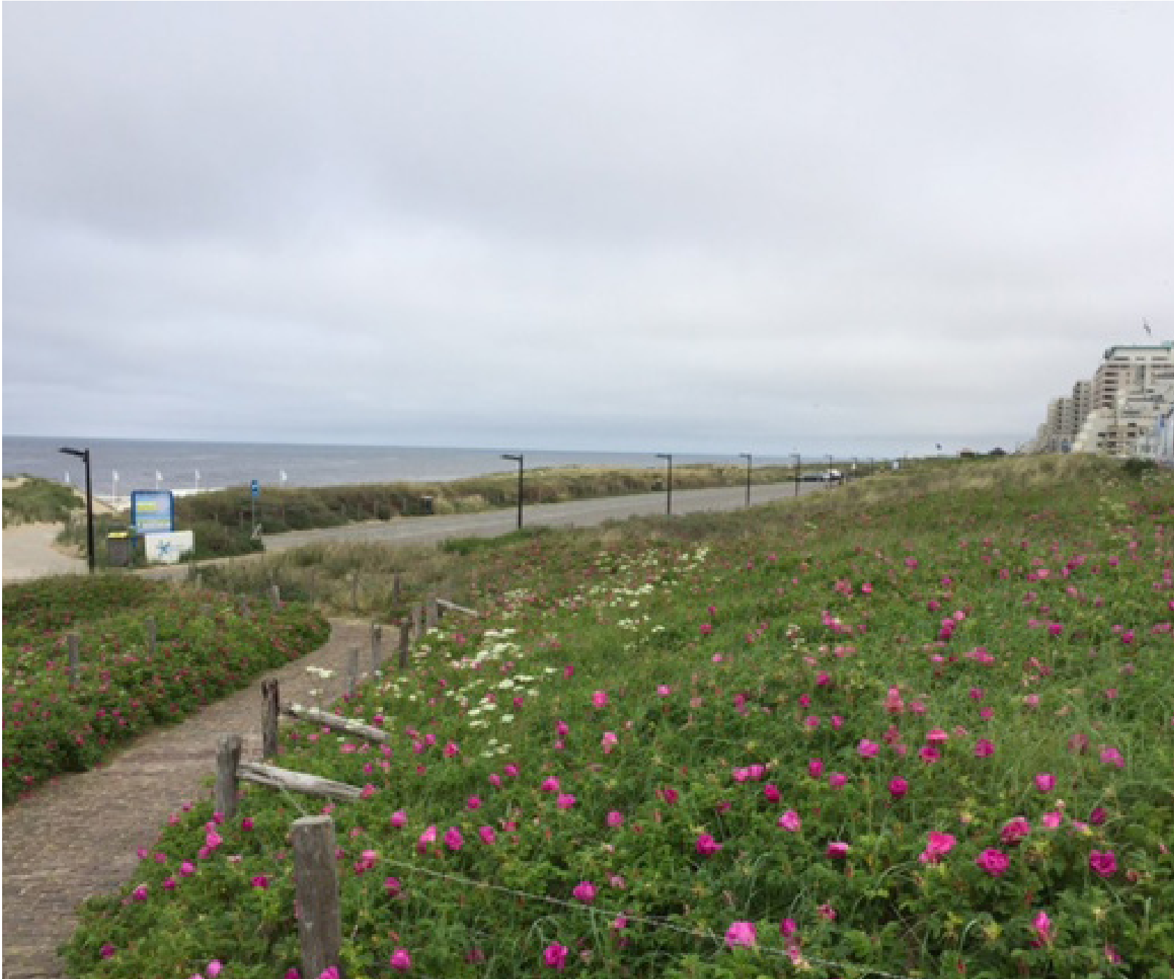
afbeelding: Kon. Astrid Boulevard