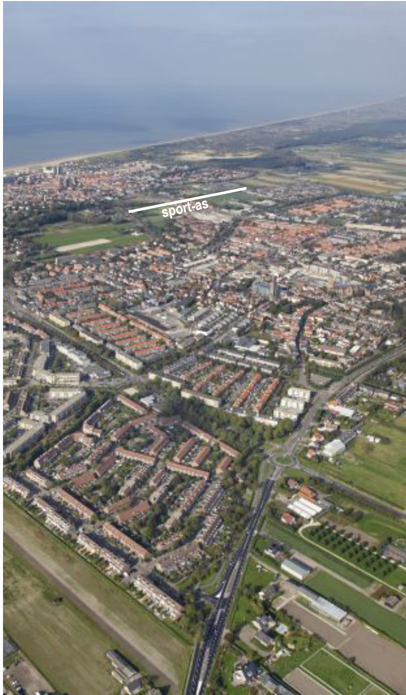
afbeelding: Luchtfoto Noordwijk

Als basisuitrusting zou het sportlint moeten voorzien in goede verlichting, een watertappunt, afstandsduiding en attributen om te strechen en te rekken. Dit allemaal kan eenvoudig worden toegevoegd aan het bestaande fietspad. In gesprek met de diverse sportaanbieders/ -coaches kunnen aanvullende elementen worden toegevoegd, zoals bijvoorbeeld digitale tijdsmeting.