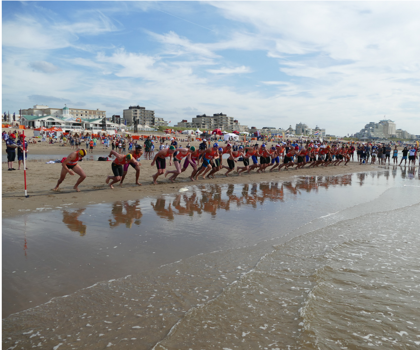
afbeelding: Sportieve evenementen strand Noordwijk