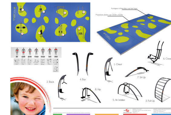
Bovenstaand een impressie voor de inrichting van het Vuurtorenplein met sporttoestellen

De Kon. Wilhelmina Boulevard verbindt deze beide pleinen aan elkaar en vormt het toeristisch hart van Noordwijk. Hier komt men recreëren, flaneren en genieten van zon, zee en lekker eten. De boulevard kent een prettige dynamiek in bebouwing en boulevard typische programmering. Alleen de beide eindpunten van de boulevard blijven achter bij de kwaliteit van de rest van de boulevard. Zowel het Vuurtorenplein als het Gat van Palace zijn grote lege pleinen met weinig uitstraling. Hoewel er voor beide locaties grote ontwikkelplannen zijn, ligt het er momenteel armoedig bij. De realisatietermijn van deze nieuwbouwplannen is niet voorzien binnen enkele maanden/jaren. Door mobiele en tijdelijke sportieve voorzieningen te realiseren op één plein (of beide pleinen) krijgt de ruimte in de tussentijd