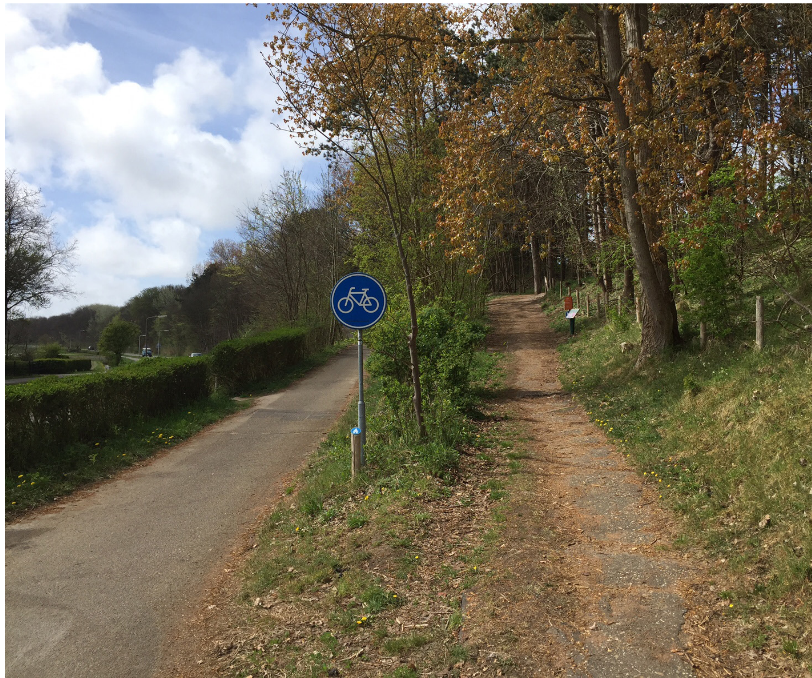
afbeelding: Boswachterij Noordwijk