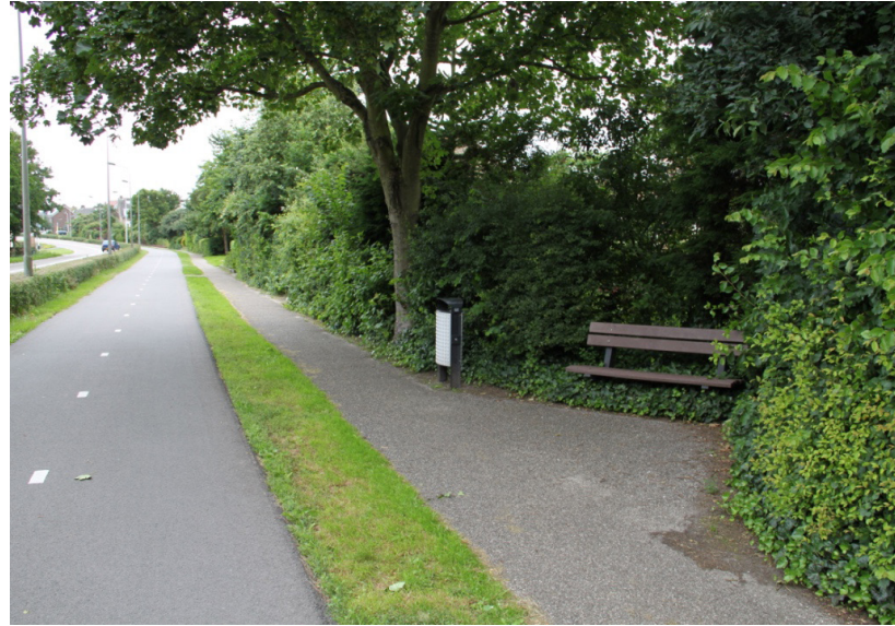
afbeeldingen: Rustplek Duinweg