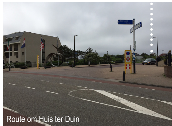
Route om Huis ter Duin