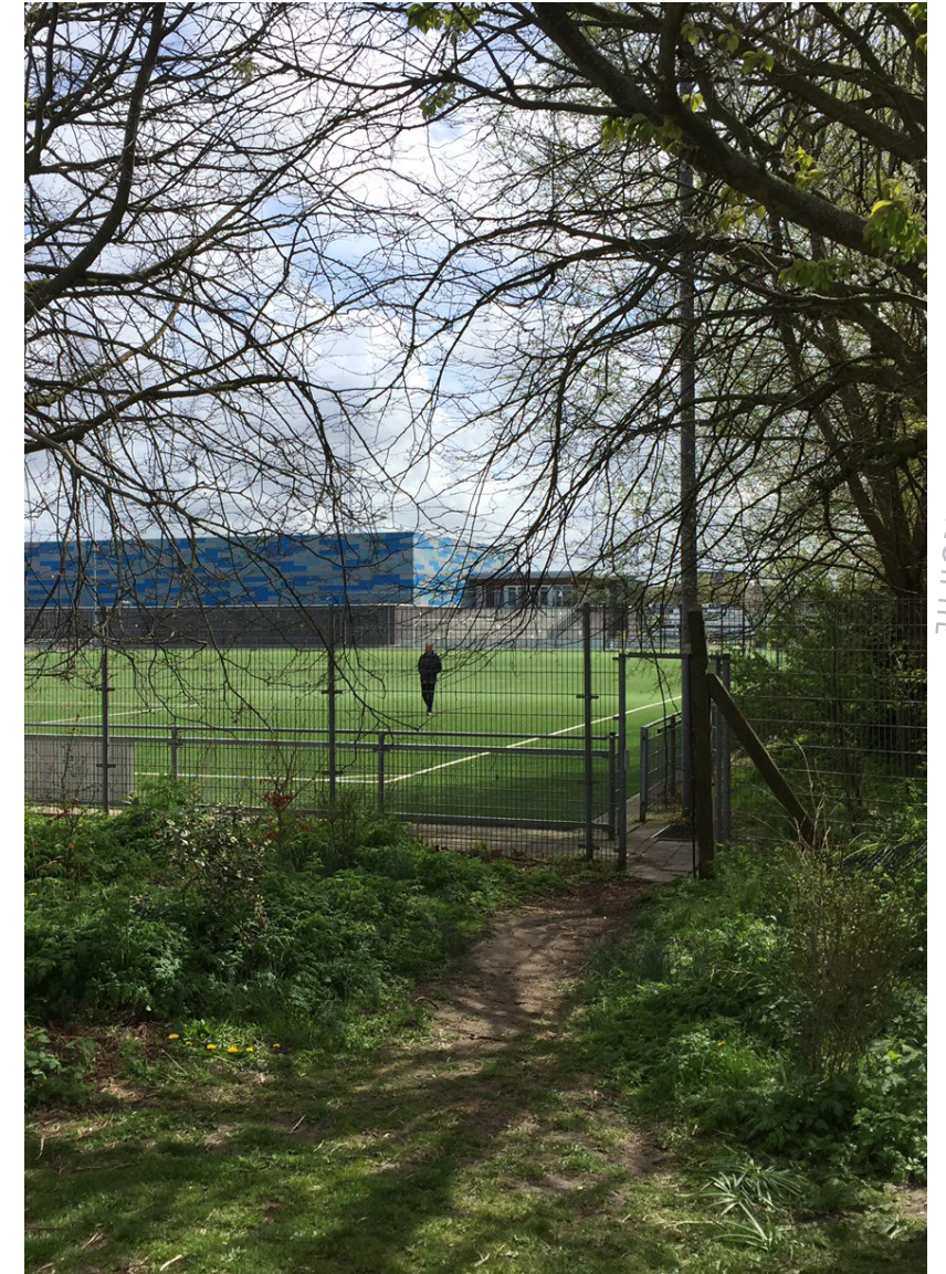
afbeelding: 'Olifantenpad' - achter sportpark Duinwetering