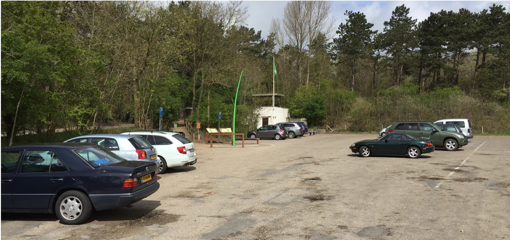
afbeelding: Boswachterij Noordwijk - parkeerplaats Duindamseslag