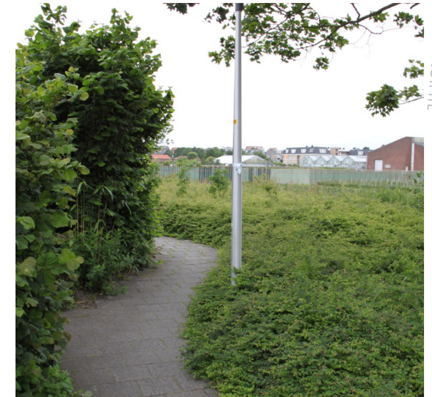
afbeelding: rustplek Boswachterij Noordwijk