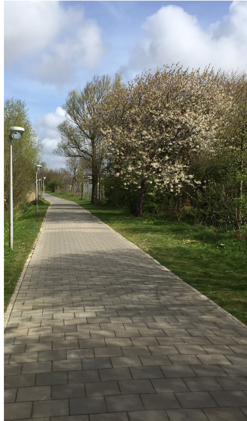
afbeelding: Locatie voor sport-as - achter sportpark Duinwetering