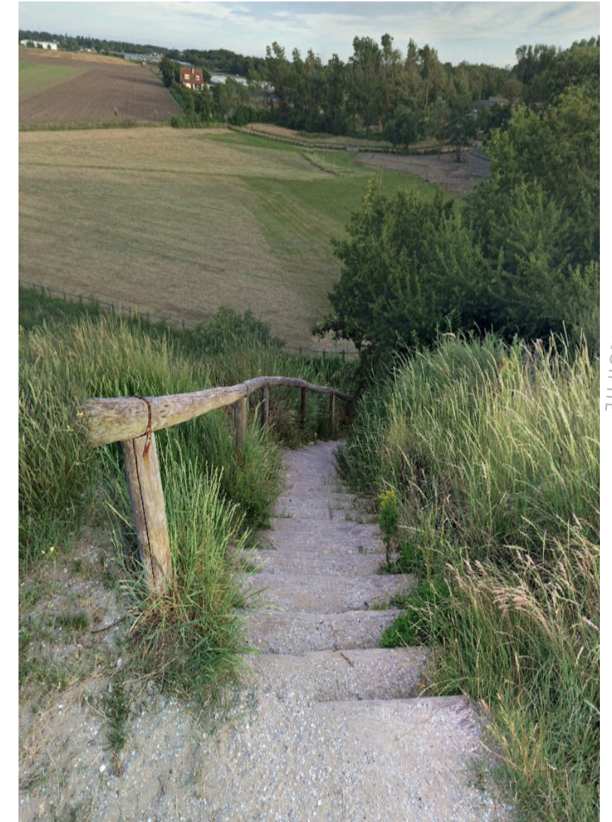
afbeelding: De Trap van Rinus

Ten zuiden van de kern van Noordwijk liggen de Coepelduynen . Dit gebied heeft een hoge natuurwaarde waardoor recreatief gebruik wordt beperkt tot het vrij struinen door het natuurgebied. Tijdens het broedseizoen is het gebied niet toegankelijk. De Coepelduynen worden vooral door individuele sporters gebruikt. Personal coaches of trainers van loopgroepen kiezen eerder voor het strand en het duingebied bij de Duinweg. De trap van Rinus is een begrip in Noordwijk en in de duinen een bekende trainingslocatie. Staatsbosbeheer benadrukt de hoge natuurwaarden van dit gebied en is content met de huidige zonering waarbij de Boswachterij als recreatief intensief gebied is ingericht en de Coepelduynen als extensief gebied.