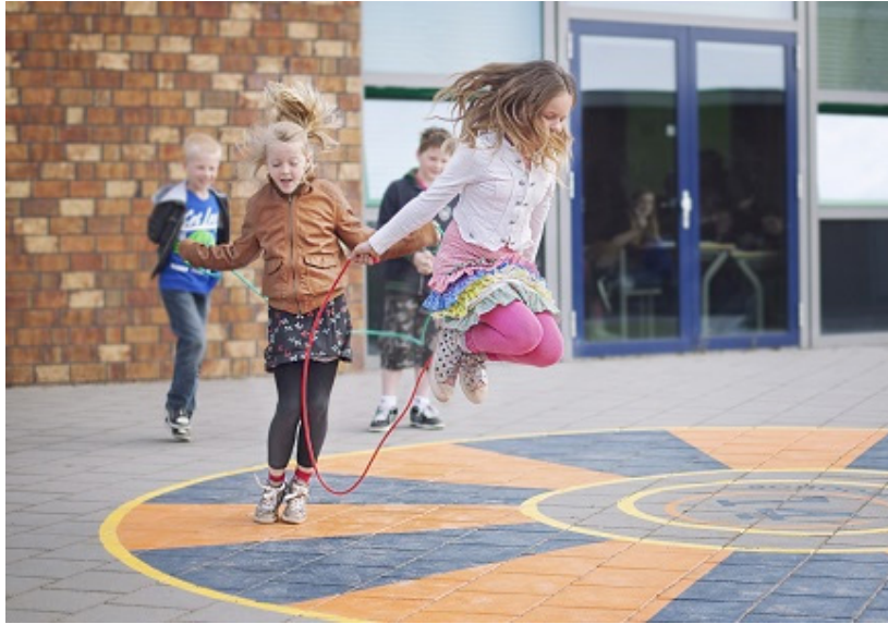
afbeeldingen: Referentiebeeld Schoolplein 14 | Cruyff Foundation